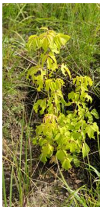
Palmate Maple 단풍나무