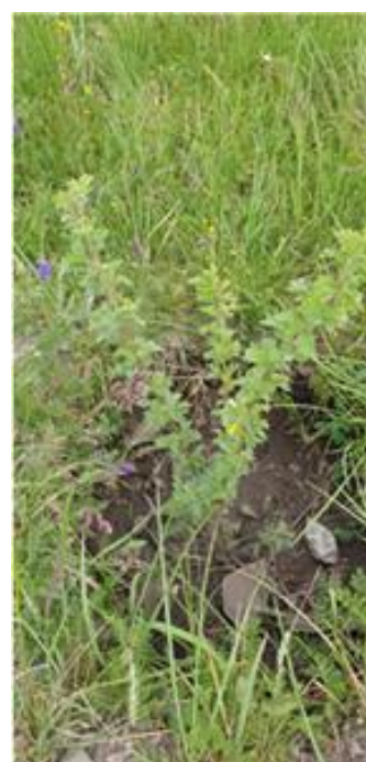
Acacia Specyabilis 아카시아