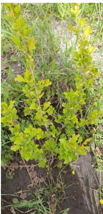
Siberian Elm 비술나무