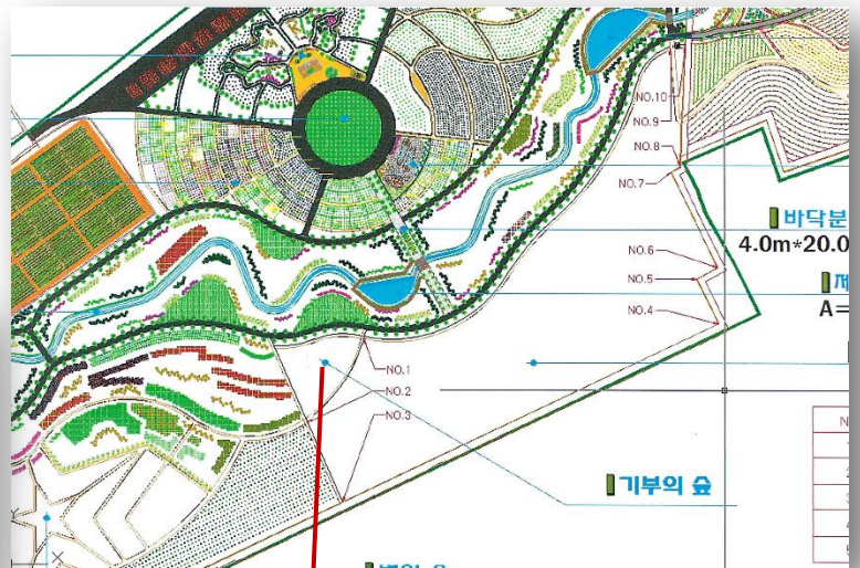
'사랑의 씨튼 수녀회 와 은인들' 조림지역