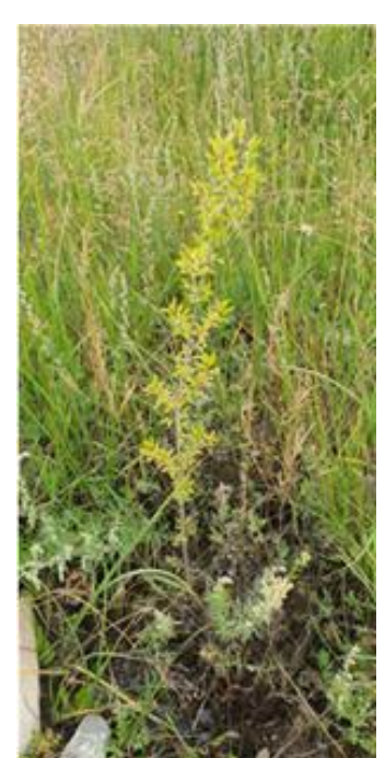
Scotch Pine 유럽소나무